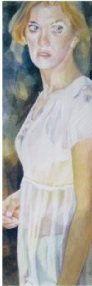
ein Augenblick zu lang - 2006 - Garn auf Organza - 140 x 190 cm