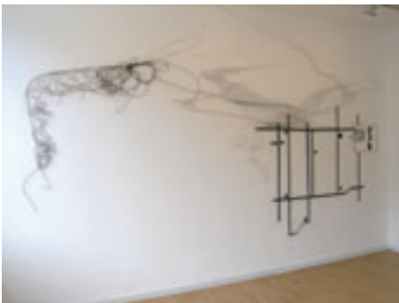
FL 100 - Flight Level one hundred, 2008, Installation, 560 x 350 cm

Auszeichnungen 2005 Förderpreis der Darmstädter Sezession, 2006 Stipendium des Cusanuswerkes und Kunstpreis der Stadt Augsburg, 2007 Preis der Jahresausstellung der Kunstakademie Karlsruhe.