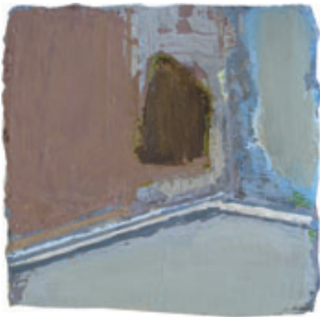
o.T., 2008, Öl auf Leinwand, 20 x 20 cm

Vier Nachwuchskünstler verschiedener Klassen und unterschiedlicher künstlerischer Positionen und Konzepte zeigen in diesem Jahr in „Klasse 07“ eine Auswahl ihrer Arbeiten: